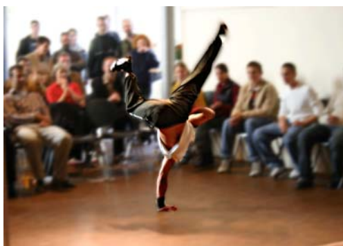
Akrobatischer Breakdancer auf der Abschlussfeier des Youth Team-Contest

Zum Ende des Youth Team-Contest sollte den teilnehmenden Jugendinitiativen das öffentliche Interesse sowie die Anerkennung und Wertschätzung ihrer engagierten Arbeit mit einer zentralen Abschlussfeier und einer feierlichen Preisverleihung verdeutlicht werden. Die Veranstaltung fand am 01.10.2004 im Werkhof Hannover zusammen mit dem 30-jährigen Jubiläum des Jugendverbandes des Paritätischen Niedersachsen e.V. statt. An der Veranstaltung nahmen gut 80 Jugendliche verschiedener Jugendinitiativen sowie 40 Gäste aus dem Bereich Politik, Verwaltung und Jugendhilfe sowie sonstige interessierte Besucher teil. Das Programm bestand aus einer ausgewogenen Mischung aus Grußworten und Festreden sowie