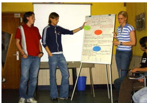
TeilnehmerInnen des Workshops zur Planung, Durchführung und Finanzierung von Jugendinitiativen

Den Aussagen der TeilnehmerInnen folgend hat der Workshop den Zielvorstellungen des Youth Team-Contest entsprochen. Es wurde Zufriedenheit mit dieser Form der Unterstützung von Jugendinitiativen geäußert und dass sich die Erwartungen an den Workshop erfüllt hätten.