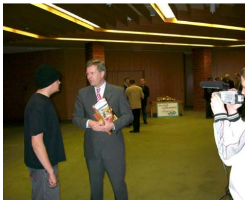
Kamera öffnet Türen: Jugendliche filmen und interviewen den niedersächsischen Ministerpräsidenten Christian Wulff

Die gemeinsame Team-Reflexion der Seminarreihe hat ergeben, dass durch die Arbeit mit dem Medium Video Veränderungsprozesse sowohl bei den einzelnen Jugendlichen, innerhalb der Gruppen und im Auftreten der Initiativen nach Außen beobachtbar waren. Neben dem Erlernen des reinen technischen Umgangs mit der Kamera und dem Computer bewirkte die Auseinandersetzung mit den Einsatzmöglichkeiten des Mediums eine individuelle wie gemeinsame Reflexion des eigenen Projektes sowie neue Impulse für das Rollenverhalten innerhalb der Gruppe. Das Ziel eines eigenen Films vor Augen mussten sich die Jugendlichen über dessen Inhalt und Ablauf verständigen, gezielt Bildmaterial sammeln, auswerten, bearbeiten und schließlich zusammenfügen. Hierfür war eine bewusste Auseinandersetzung mit den eigenen Vorstellungen, denen der Projektpartner und den Reaktionen der Außenwelt auf die Kamera sowie geplantes Vorgehen mit Absprachen und Aufteilung von Verantwortung erforderlich. Während ihrer Dreharbeiten traten die Jugendlichen nach eigenen Angaben sowohl vor als auch hinter der Kamera ernster und selbstbewusster nach Außen auf. Dabei