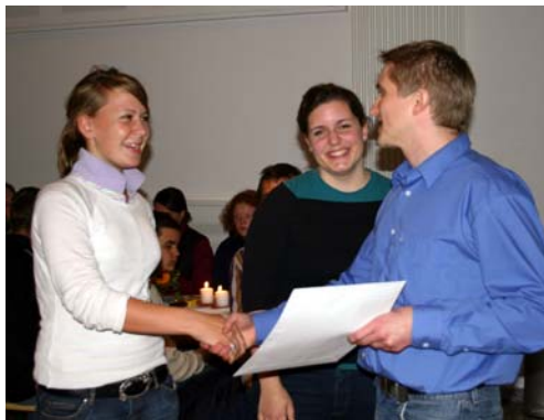
Das Foto zeigt die Überreichung des 1. Preises

Die Auswahl der PreisträgerInnen des Youth Team-Contest erfolgte bereits am 07.09.2004 im Rahmen der Sitzung einer 5-köpfigen Jury, der folgende Personen angehörten: